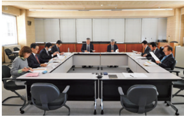
医療制度等対策委員会