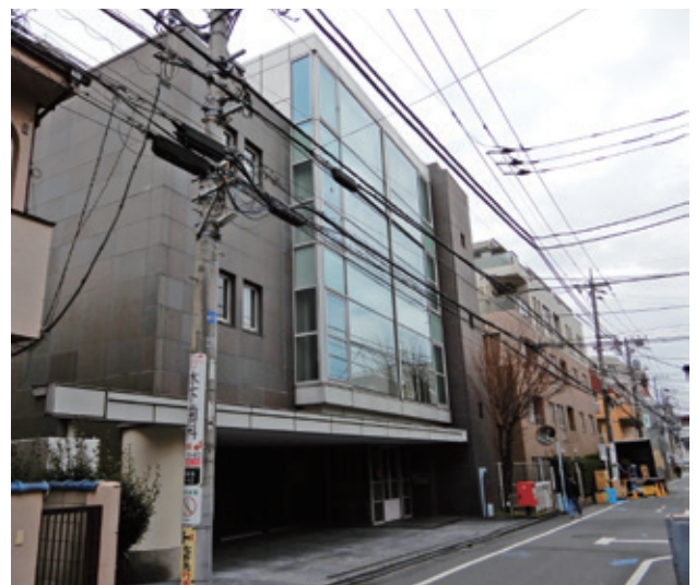
事務所は回路会館の3階

健保組合は昭和59年の設立で、当時の母体の名称と同じ「プリント回路工業健康保険組合」としてスタートしたが、母体の名称変更に伴って、平成16年9月に「電子回路健康保険組合」となった。