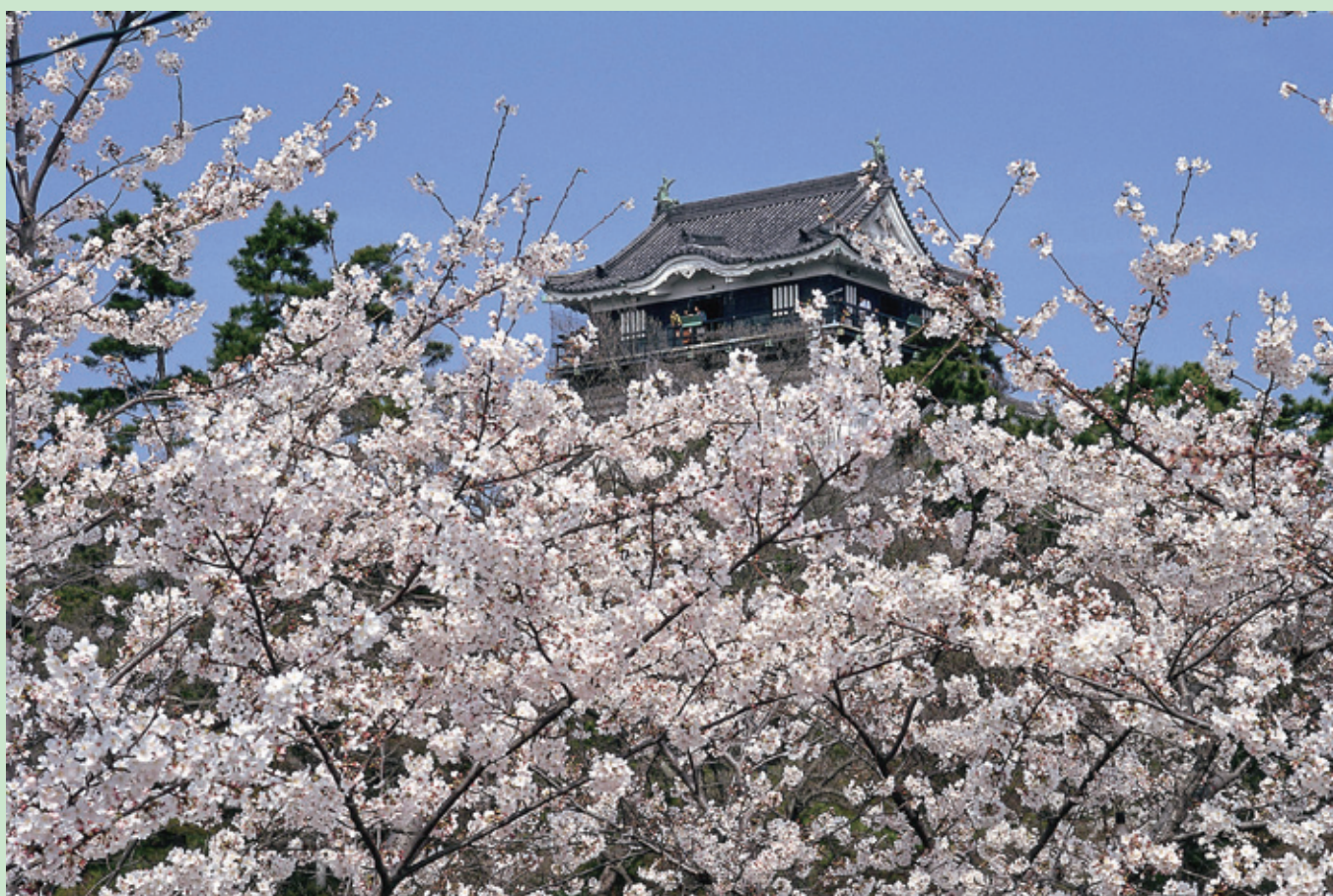
春の岡崎城（愛知県）